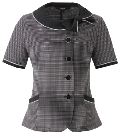
オーバーブラウス 26502-2(黒)