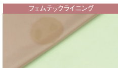
フェムテックライニング

それぞれの生地内側へ水を叩き込み、裏地の下に敷いた紙にどのくらい水分が滲むか検証してみました。内側にはどちらも吸水性がありますが、フェムテックライニングは、しっかりと透湿ポリウレタンフィルムが水分をストップしてくれます。