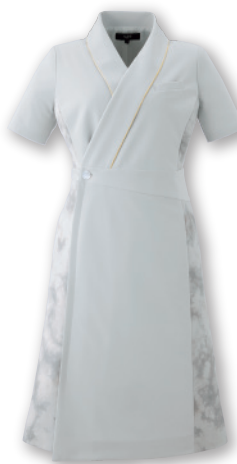
62104-48(アイスグレー) ¥34,900(税込¥38,390)